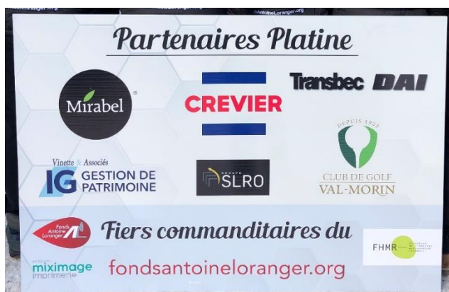
Deux exemples de visibilité : manteau de ski avec logo, et affiche « merci à nos partenaires »