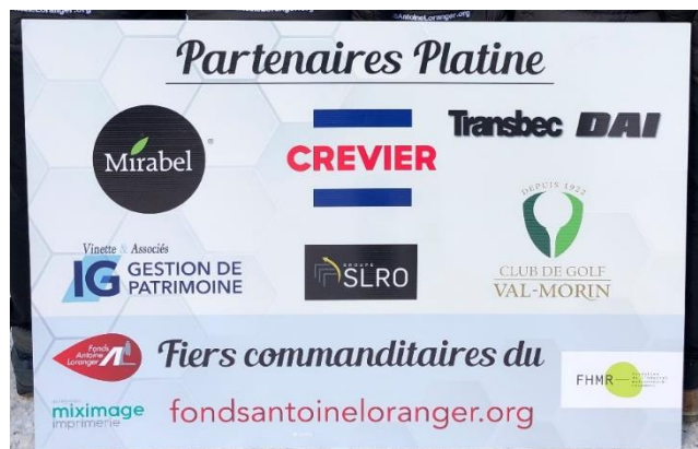
Deux exemples de visibilité : manteau de ski avec logo, et affiche « merci à nos partenaires »